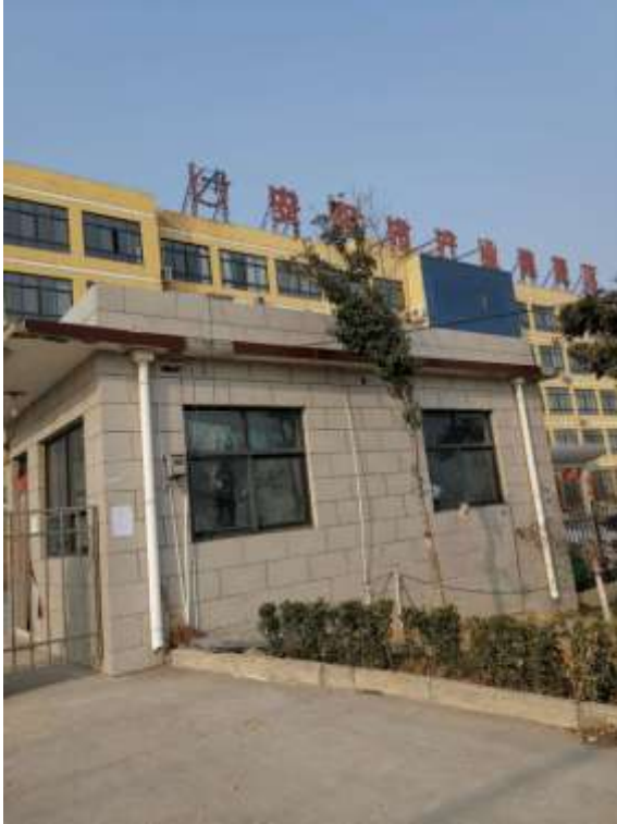
安阳市产业集聚区管委会张贴公示