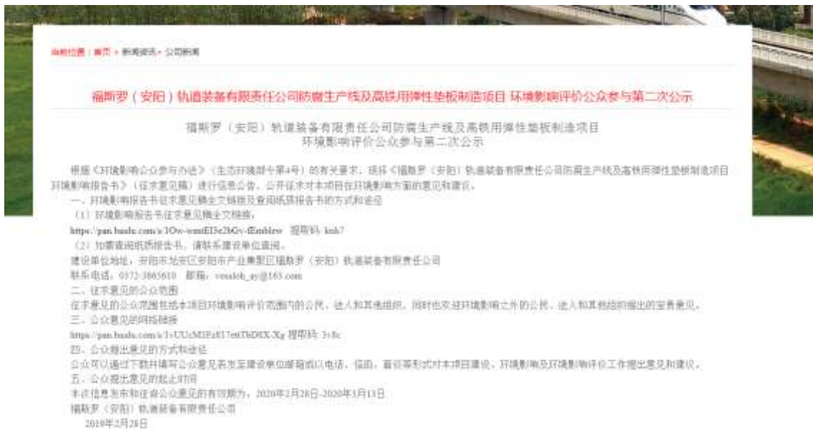
图 3-1 本项目第二次公示网站公告

本单位在安阳市铁路器材有限责任公司网站上对本项目进行了环境影响评价第二次公示，载体的选取符合《环境影响评价公众参与办法》（部令 第4号）对于公示网络平台的要求。网络公示时间为2020年2月28日~2020年3月13日（共计10 个工作日）、网址为 http://www.aytlqc.com/content/?494.html 。本项目第二次网站公告截图见图3-1。