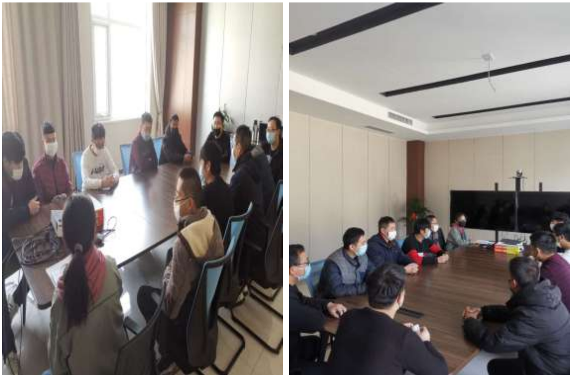
图 4-1 本项目公众参与座谈会现场

首先，会议由福斯罗（安阳）轨道装备有限责任公司安环部长介绍了本单位主要生产产品情况及本项目的的基本情况，随后与会代表对该项目的环境影响情况进行了深入讨论、积极发言，最终通过本单位与评价单位的讲解，使公众消除疑虑，本项目公众参与座谈会圆满结束。