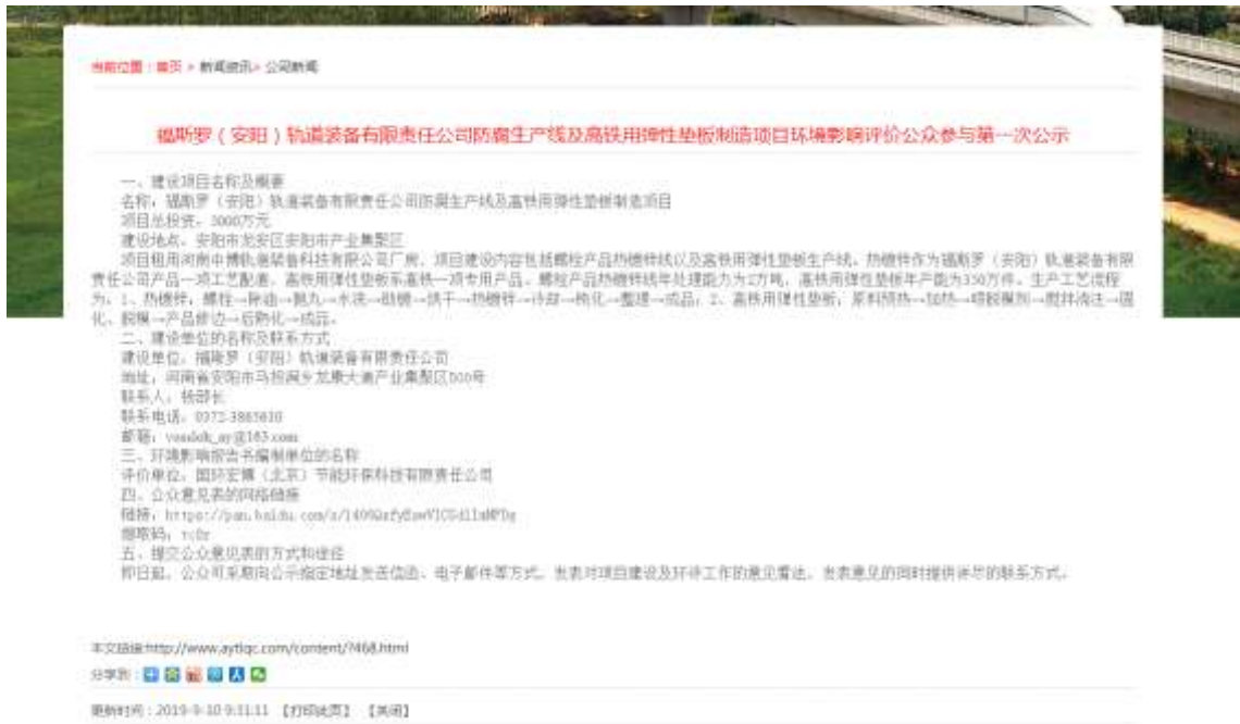
图 2-1 本项目第一次公示网站公告